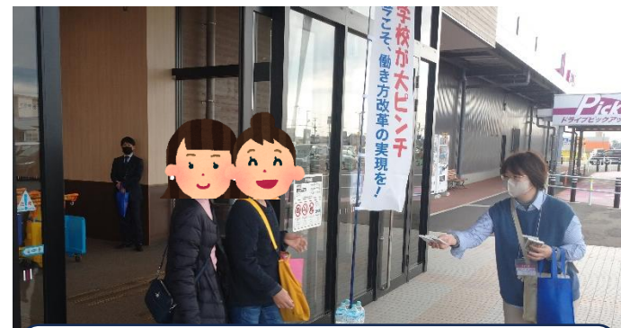
【イオンタウン能代での街宣行動の様子】 たくさんのご家族がシール投票に協力くださいました！